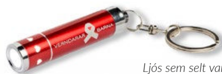
Ljós sem selt var í landssöfnun Barnaheilla 2022

Haustsöfnun Barnaheilla 2022 er árlegt fjáröflunaráttak til styrktar þróunarverkefni Barnaheilla í Síerra Leóne. Söfnunin var haldin í annað sinn og stóð yfir í 10 daga frá 25. ágúst til 5. september. Söfnunin gekk vonum frammar, þar sem tæplega 10.000 armbönd voru seld víða um land og í vefverslun Barnaheilla.