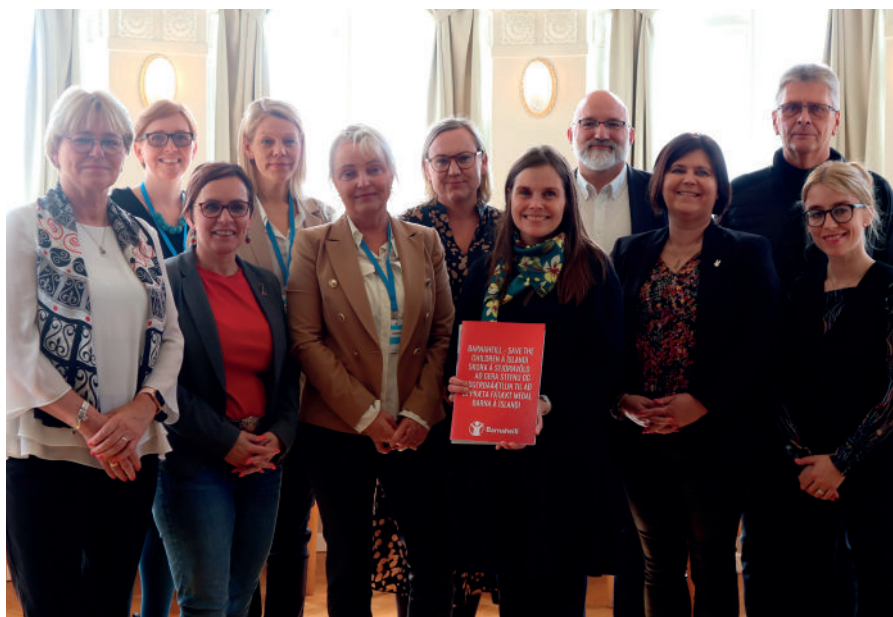
Starfsfólk Barnaheilla afhentu forsætisráðherra undirskriftarlista og skoruðu á íslensk stjórnvöld að uppræta fátækt meðal barna á Íslandi.

Í tilefni Dags mannréttinda barna voru haldnir dagar umburðarlyndis og fengu allir leik- og grunnskólar landsins aðgang að fjölbreyttu efni á vef Barnaheilla. Dögum umburðarlyndis lauk með litríka deginum og tóku þó nokkrir skólar þátt í þessu með okkur.