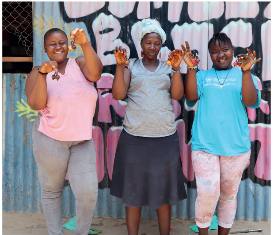
Handverksfólk í Sierra Leóne framleiddi 12.000 armbönd og 10.000 lyklakippur fyrir Barnaheill sem selt var sem fjáröflunarvarningur.

Í febrúar hófu Barnaheill neyðarsöfnun til styrktar mannúðaraðstoð alþjóðasamtaka Barnaheilla í Tyrklandi og Sýrlandi í kjölfar jarðskjálftanna sem urðu þar þann 6. febrúar. Á jarðskjálftasvæðinu misstu 716.000 manns heimili sín. Alls söfnuðust 1.5 milljón í neyðarsöfnuninni.