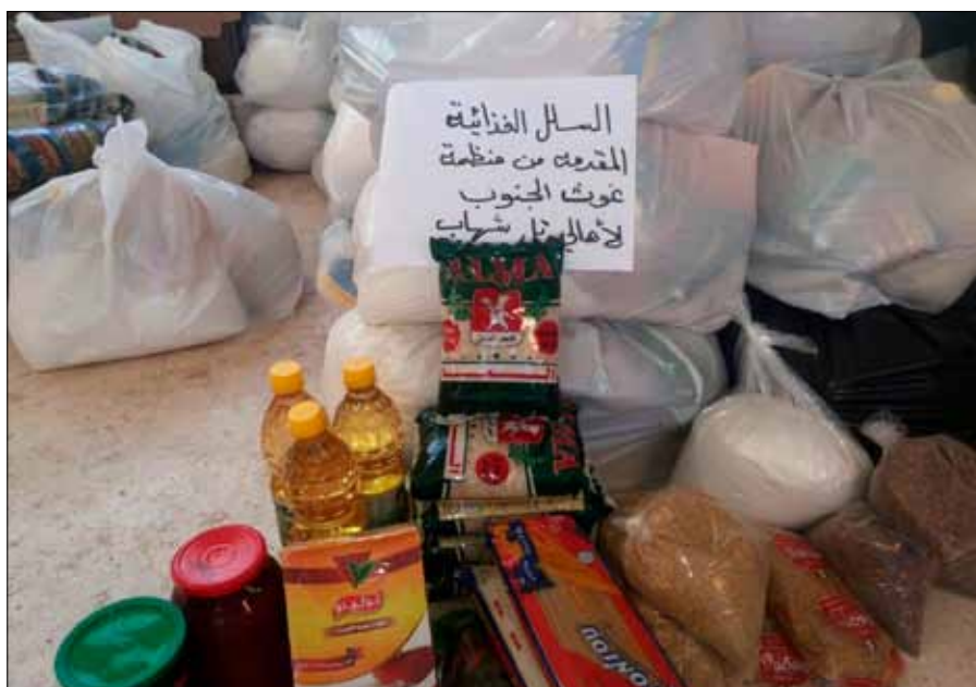
Matarbirgðir í Tel Shihab í Dara'a héraði.